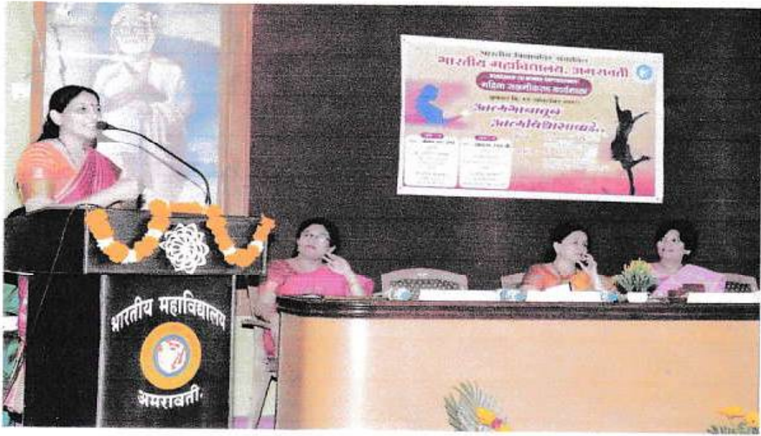
Workshop - Atmabhanatun Atmawishvasakade